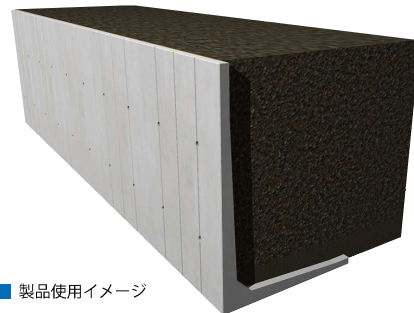
■ 製品使用イメージ