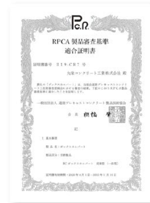
(一社) 道路プレキャストコンクリート 製品技術協会